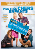
MES TRÈS CHERS ENFANTS