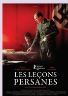
LES LEÇONS PERSANES