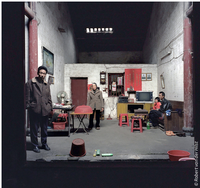
Intérieur chinois , Robert van der Hilst - 2002

dans des revues prestigieuses telles que Géo , Stern , Elle ou Vogue Magazine . Avec la série « Intérieurs chinois et cubains » issue d'une série de reportages réalisés depuis les années 2000, Robert van der Hilst entreprend de donner vie à l'un de ses projets les plus personnels : donner à voir l'essence d'un pays à travers ses habitants. Ses clichés reflètent avec authenticité et justesse la diversité des modes de vie. Il parvient à y retranscrire toute l'hospitalité de ceux qui l'ont reçu, et toute la beauté qu'il a su voir dans la relative pauvreté