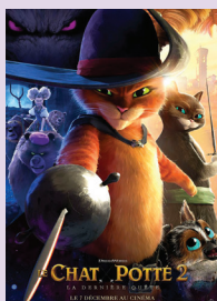
LE CHAT POTTÉ 2