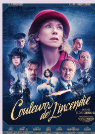
COULEURS DE L'INCENDIE