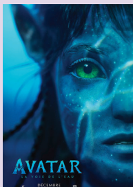
AVATAR : LA VOIE DE L'EAU